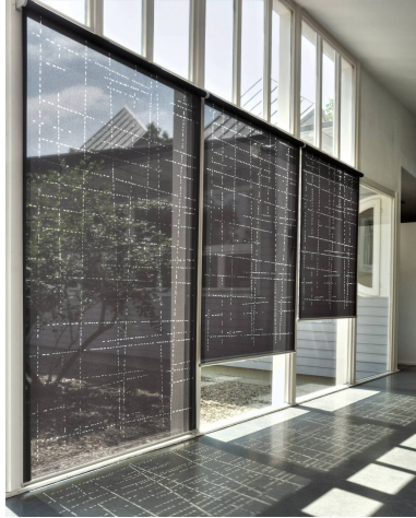
LASER STITCH R ART.-NR. 0099843

Anwendung: Rollo Anzahl Colorits: 1 Material: max. Rollobreite: 180 cm max. Rollohöhe: 300 cm